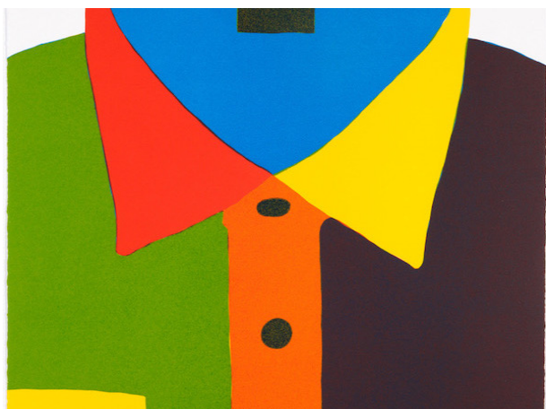
Vincent Kohler, Chemise , 2015

Exposition du 2 juin au 2 septembre 2017 Vernissage le jeudi 1er juin, à partir de 18h30