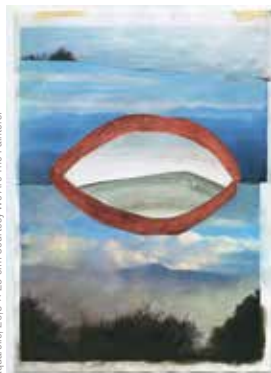
We Are The Painters, Bouche Céleste, 2017, collage, impression jet d'encre, aquarelle, 20,6 x 28 cm.

Surface en réparation depuis 3 ans, la galerie 40mcube revient dans un nouvel écran entièrement remis à neuf. Et pour exposer au grand jour ce noble retour, elle fait appel à une entité atypique dans le monde de l'art en général et de